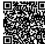
Jadwal Penerimaan 2021