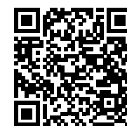
Jadwal Penerimaan 2022