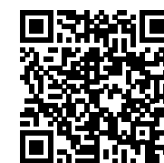
Biaya Pendidikan S1 Reguler