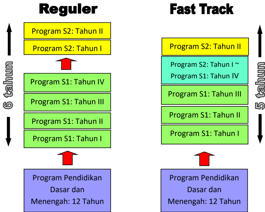
Gambar 1. Konsep program Fast Track Magister Teknik

Program Fast Track Universitas Indonesia memiliki karakteristik sebagai berikut :